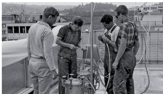
Le Kemperol® s'applique à froid, simplifiant la tâche des couvreurs.

Résultat de plusieurs années de recherche en ingénierie chimique, cette solution est basée sur l'application d'une résine liquide armée d'un voile textile. Réalisée in